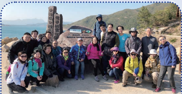
2018年1月13日，「天文台之友」導賞員到糧船灣地質公園，與香港聯合國教科文組織世界地質公園導賞員進行交流。