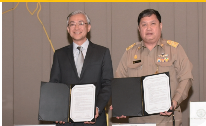
天文台台長岑智明（左）與泰國氣象局局長 Wanchai Sakudomchai 在合作諒解備忘錄簽署儀式上合照

天文台與泰國氣象局的合作關係歷史悠久，可追溯至1970年，天文台透過世界氣象組織全球電信系統建立了香港與曼谷之間的氣象信息交換線路。在簽署儀式前舉行的高層會議上，天文台與泰國氣象局同意在多個領域進行合作，包括風切變探測、雷暴臨近預報、協調航空重要天氣警告發放，以及氣象人員培訓。