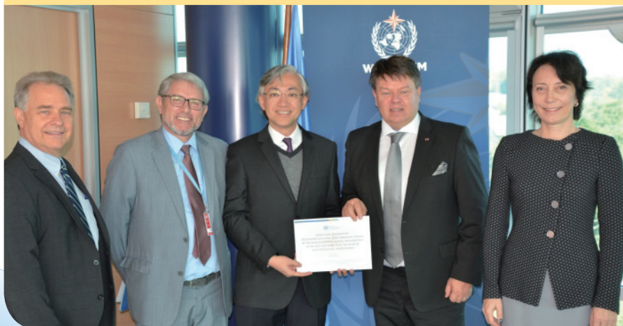
香港天文台台長岑智明（中）在瑞士日內瓦接受世界氣象組織秘書長佩特里·塔拉斯教授（右二）頒發長期觀測站認可證書。

位於尖沙咀的香港天文台總部獲世界氣象組織認可成為首批百年觀測站之一。10月18日，天文台台長岑智明在接受世界氣象組織秘書長頒發認可證書。他形容香港天文台總部獲得百年觀測站這項國際認證是一個重要里程碑。