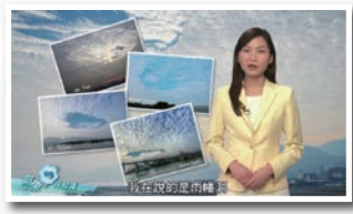
經過三十年的演變，電視天氣節目質素不斷提升