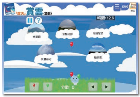
《度天賞雲》電子書的互動遊戲

http://kids.weather.gov.hk/V2/eBook/ebook_cloud/ebook_shelf_uc.htm