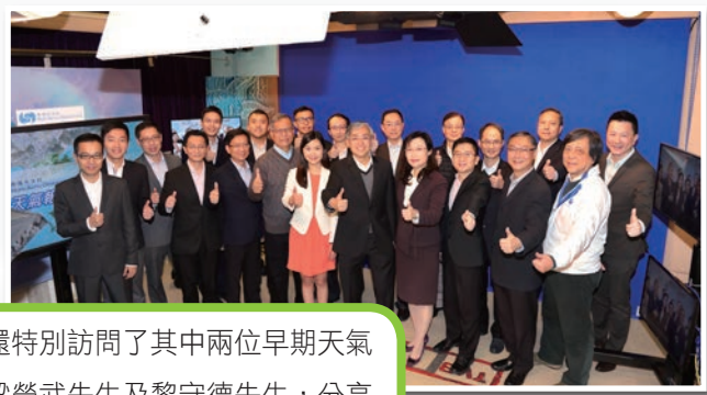
2017 年在拆下舊佈景的前一天，不同年代的電視天氣節目主持人和台長在錄影室合照留念！

為迎接未來電視天氣服務新一頁，天文台錄影室已於今年進行優化工程，把服務我們超過 15 年的藍色佈景轉換為更廣闊的綠色佈景，以加入更多的拍攝角度，提升節目畫面質素。