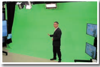
2017 年更換了新的綠色佈景