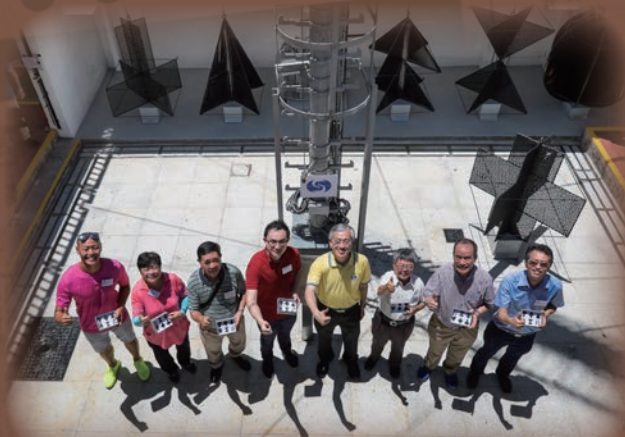
台長岑智明（右四）在長洲氣象站與嘉賓合照

6月7日，天文台在長洲氣象站向傳媒介紹「風球」歷史的展品。台長岑智明表示，香港的數字颱風信號系統簡單易明，深入人心，過去一百年在颱風吹襲期間保障了市民的生命及財產安全，並希望市民透過回顧信號系統的演變及風災歷史，提高防災意識，防範熱帶氣旋帶來的威脅。