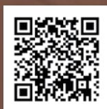
「數字颱風信號百周年」紀念郵票及銷售安排