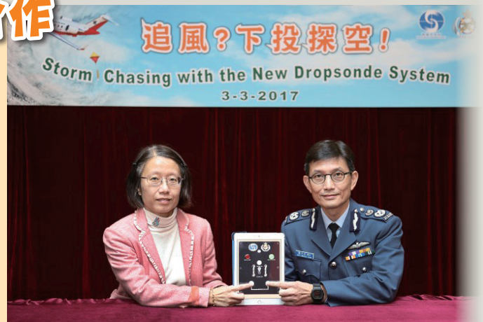
政府飛行服務隊總監陳志培機長（右）和天文台助理台長劉心怡（左）在聯合記者會上介紹下投式探空系統

市民可於天文台的 YouTube 頻道觀看有關天文台與飛行服務隊合作引入的下投式探空系統的短片。