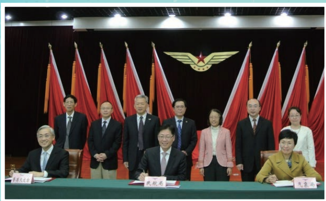
台長岑智明（前排左）、中國民用航空局副局長王志清（前排中）和中國氣象局副局長矯梅燕（前排右）在北京簽訂協議。

香港天文台、中國民用航空局及中國氣象局於2016年10月28日在北京簽訂聯合建設亞洲航空氣象中心的協議。