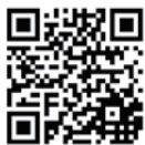
《學校天氣資訊網頁》

迎接新學年的開始，天文台於8月底推出《學校天氣資訊網頁》的新版本 ( http://www.hko.gov.hk/school/mainc.shtml )。新網頁增設每十五分鐘更新一次的分區雨量列表，讓學校、家長及學生即時掌握各區最新的降雨情況。網頁亦增設圖示，讓使用者更方便地連結至雷達圖像、實時和預報的雨量分佈圖，了解不同地區的降雨趨勢，以作出相應的應變措施。