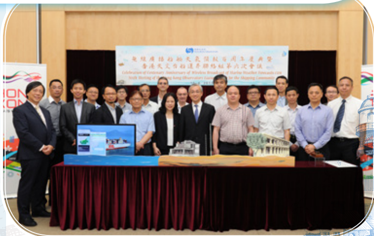
天文台與船運界聯絡組成員慶祝無線廣播船舶天氣預報百周年