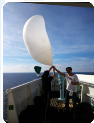
探空氣球升空前一刻，強風把氣球吹至變形。

另外，天文台亦委託OOCL另一艘貨櫃輪「東方亞特蘭大號」(M.V. OOCL ATLANTA)於6月26日航行至南海時投下一個配備量度氣壓及海水溫度感應器的飄移浮標，讓其在氣象觀測資料貧乏的海域上隨水漂流，每小時把所在位置的氣壓及海水溫度數據通過衛星傳送回天文台。