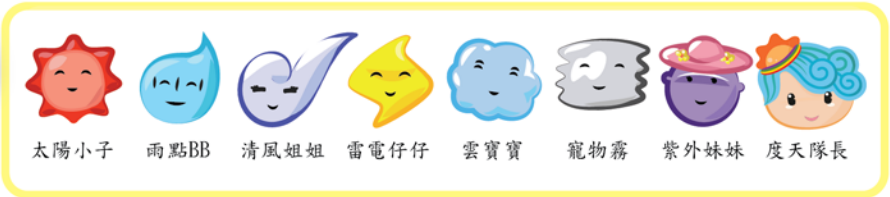
太陽小子 雨點BB 清風姐姐 雷電仔仔 雲寶寶 寵物霧 紫外妹妹 度天隊長