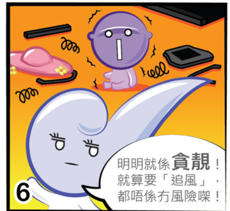
繪圖 / Felicia Kong