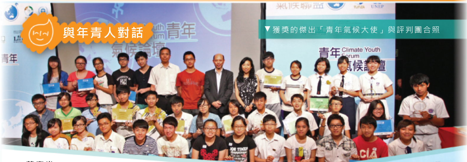
▼獲獎的傑出「青年氣候大使」與評判團合照