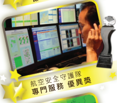
航空安全守護隊 專門服務 優異獎