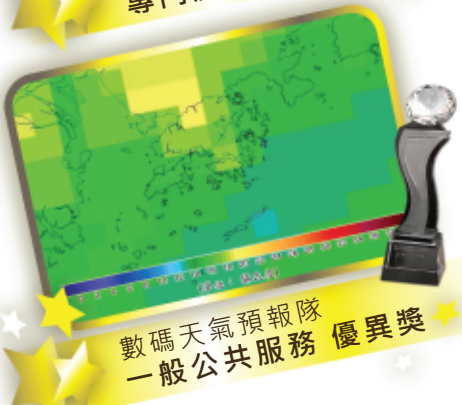
數碼天氣預報隊 一般公共服務 優異獎