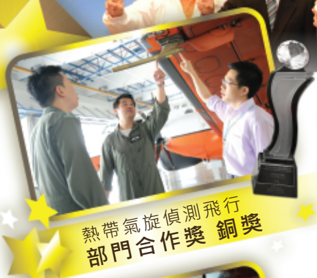
熱帶氣旋偵測飛行 部門合作獎 銅獎

電郵：hkof@hko.gov.hk / 網址： http://www.hko.gov.hk/sugg_formc.htm